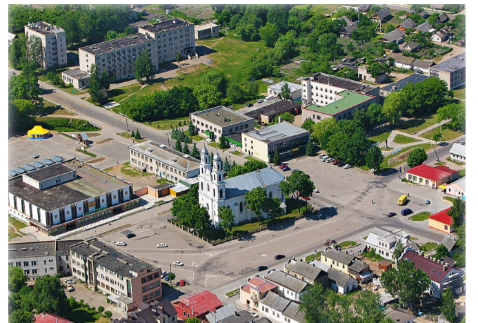
«Рыночная» площадь в наши дни

Как и во всех местечках, в Дятлово регу-