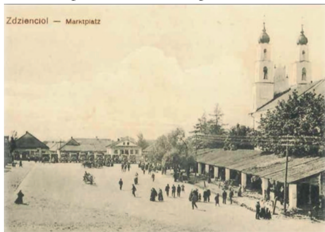
Рыночная площадь, конец XIX века

Была в местечке и своя развилка. Здесь находился перекресток дорог в направлении Слонима, Лиды и Новоградка. Застройка местечка, особенно его центральной части, была очень плотной. Это являлось причиной больших бедствий – частых пожаров. Например, в 1743 году пожар уничтожил все местечко. Сгорел тогда и костел, кроме стен. Сгорел костельный архив, а в подзем-