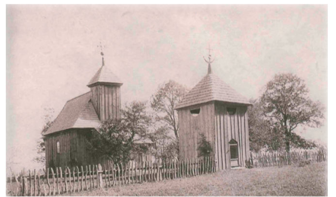
Церковь. XVIII в. мест. Дятлово. Фото начало XX века

В 30-е годы, в честь праздника Независимости Польши (Дятловщина тогда находилась в составе Речи Посполитой) она носила название «Площадь 11-го ноября». После воссоединения Западной Беларуси с БССР в 1939 году получила новое название «Площадь 17 сентября». Во время Великой Отечественной войны 1941-1945 гг. немцы переименовали ее в «Площадь Адольфа Гитлера». В наши дни центральная площадь в Дятлово называется «Площадь 17 сентября». Правда от южной и западной ее сторон остались только фотографии.