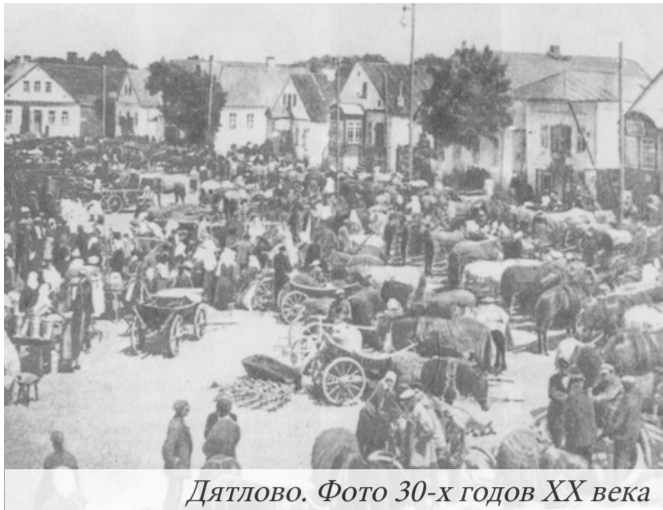
Дятлово. Фото 30-х годов XX века

течение пяти веков побывали следующие населенные пункты: Вензовец, Дворец, Дятлово, Козловщина, Новоелья, Роготно.