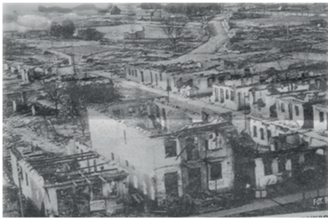
Дятлово после пожара. 1933 г

С востока местечко граничит с Новоградской возвышенностью, с запада – Неманской низменностью. Около Дятлова находилась наиболее узкая часть заболоченной долины реки Дятловка. А это, во-первых, облегчало переправу через болота, а, во-вторых, поселение стояло как бы на страже брода и во время конфликтов могло даже малыми силами задержать передвижение неприятеля.