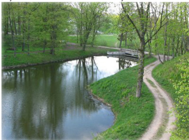
Живописный берег реки Пульвы

Коренных жителей Высокого отличает особый патриотизм. И строить свой собственный дом большинство «тутэйшых» предпочитают на родине, несмотря на то, что в случае необходимости продажи, деньги, вложенные в провинциальную недвижимость, с большой долей вероятности не отобьются. Настраивать местечковый народ на коллективные жалобы долго не нужно – был бы повод. Попытались закрыть местную больницу – тысячи протестующих. «Погибает» речка Пульва – массовые возмущения. Непо-