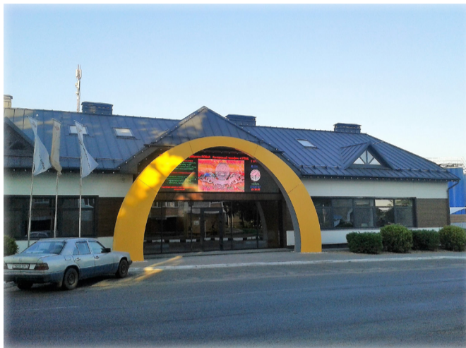
СОАО «Беловежские сыры»

ным покупателем – Россией. Братский восточный сосед сегодня в состоянии создать проблемы и придержать продукцию поставщика на переполненных складах. Приостановить производство этой самой продукции невозможно из-за непрерывных поставок молока с «колхозов». А если приостановить, то исходная «кормушка», носящая экономический термин сырьевая зона, навсегда убежит к главному конкуренту. Соседний производственный гигант из Бреста ОАО «Савушкин продукт» успешно и широко зарекомендовал себя на внутреннем и внешнем рынках. У «Беловежских сыров» цена на продукцию по-