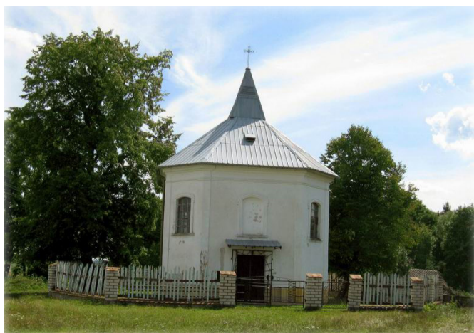
Часовня Святой Варвары

По другую сторону моста располагается дворец-усадьба Потоцких с флигелем. Внешний вид целиком сохранился, но состояние этих двух запущенных зданий вызывает лёгкое смущение. Были попытки властей поиска инвестиций для возрождения, однако немногочисленные инвесторы так и не разглядели коммерческой жилки в данном направлении. Восстановление стоящих на честном слове построек с сохранением архитектурных изысков и иными обязательными сопутствующими условия-