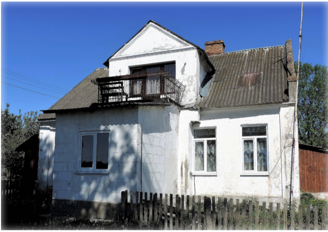
Дом моего детства

Дом №13 – бывшая панская усадьба, по понятным причинам перешедшая в эпоху социализма в муниципальную собственность. Удивительно, но спустя почти четы-