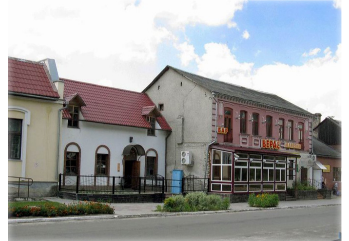
В центре города

Осенью в городе Высокое пройдёт областная фестиваль-ярмарка «Дожинки-2018». Уже обнесен строительным забором и поставлен под охрану исторический дворец-усадьба Потоцких. В утвержденной программе по подготовке к празднику запланированы мероприятия по благоустройству, асфальтированию улиц, ремонту фасадов и кровель зданий, замене подземных коммуникаций, наружных сетей жизнеобеспечения и т.п. на общую сумму 10,743 миллиардов рублей, включающей средства районного и областного бюджета, а также собственные средства предприятий. Такого масштабного движения в новейшей истории Высокого ещё не наблюдалось.