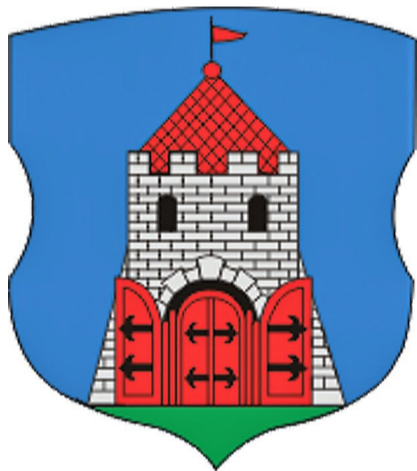
Герб города Высокое

Высокое, с его нынешним населением (около пяти тысяч жителей), является одним из самых малых населённых пунктов республики, имеющих городской статус. Тем не менее, он имеет богатую историю, исток которой берет начало в XIV веке, когда появились первые летописные упоминания о Высоком Граде (так изначально называлось поселение), основанном князем Гедымином. Расположен город на реке Пульва – притоке Западного Буга. Учитывая нынешнее состояние реки, трудно поверить, что когда-то она была судоходной.